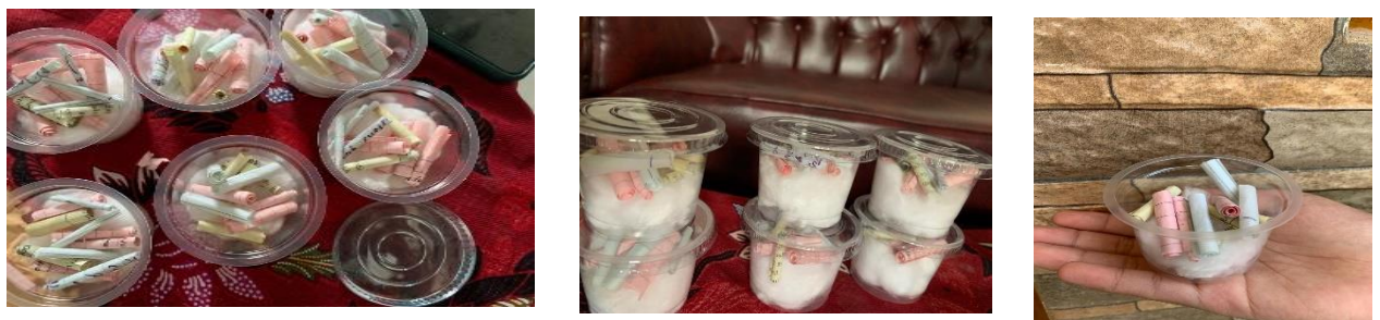
Gambar 4. Paper Soap siap digunakan