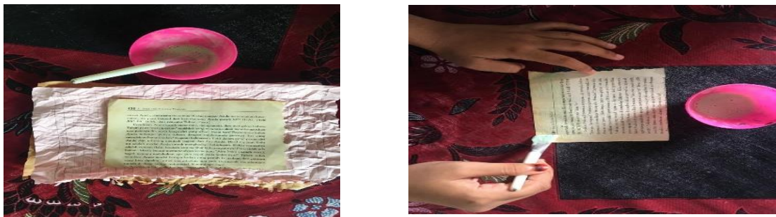
Gambar 2. Kertas diberi olesan sabun cair